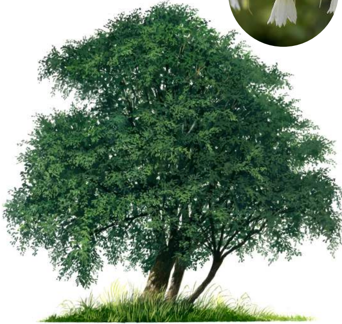
Andrés Jullian F.

Árbol siempreverde, de abundantes ramas y copa redondeada. Alcanza a crecer hasta 15 m de altura y su tronco mide cerca de 1 m de diámetro. La corteza es gris e irregularmente agrietada.