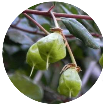
M. Teresa Eyzaguirre

Árbol siempreverde, de abundantes ramas y copa redondeada. Alcanza a crecer hasta 15 m de altura y su tronco mide cerca de 1 m de diámetro. La corteza es gris e irregularmente agrietada.