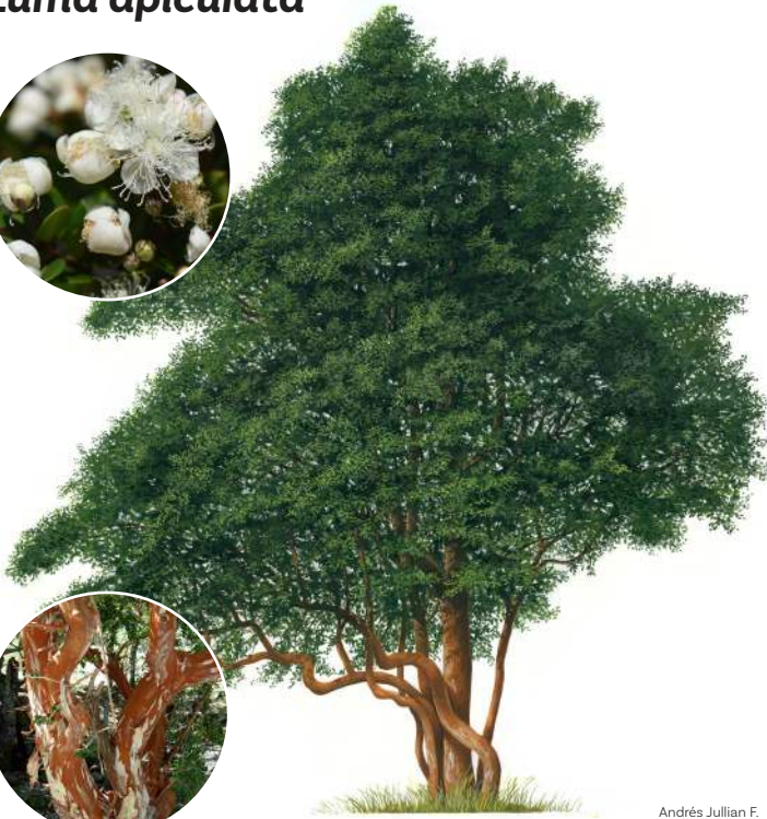
Andrés Jullian F.

Árbol o arbusto siempreverde, de hasta 25 m de altura. El tronco es generalmente torcido y llega a medir unos 50 cm de diámetro. Su corteza es lisa, de color rojizo y se desprende periódicamente, dejando sectores blancos. Destaca por su pequeña flor, de color blanco cremoso, y tallo de color anaranjado en árboles jóvenes y adultos.